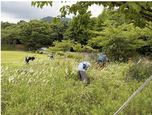
チガヤの白い穂が目立つエリア。前回の調査ではチガヤの葉を使った巣が見つかりましたが…。