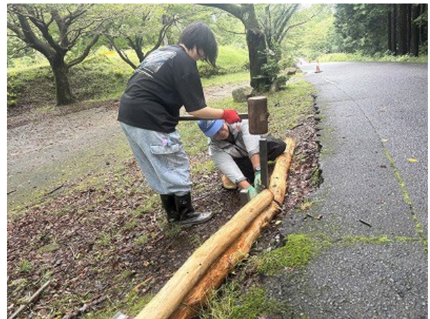
杭を打ち込む様子。まっすぐ叩き込むのはなかなか難しいのですが、皆さま手慣れたものでした。