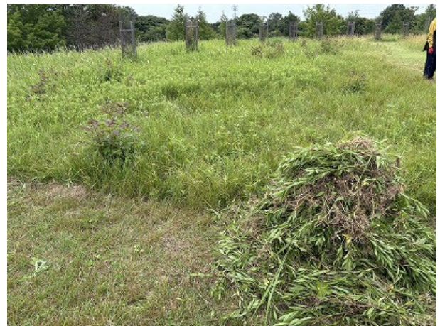
抜き取ったセイタカアワダチソウ（画像左）と、まだまだ残るセイタカアワダチソウ群落。どんな成果が出るか、長い目で見守ります。