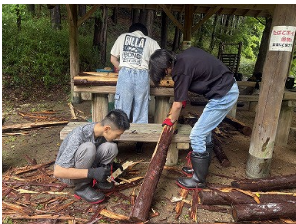
皮むきの様子。伐りたてと、そうでないのでは剥きやすさが違います。