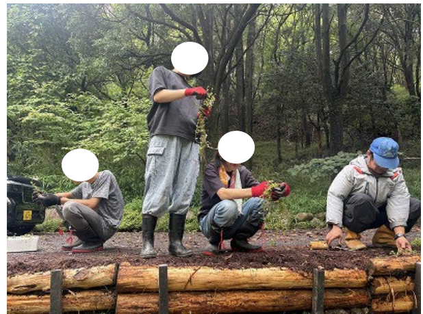
試験的にグランドカバーになりそうな花を植えました。シカにやられませんように。