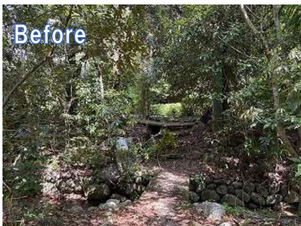
ちびっこ広場から東へ向かう遊歩道