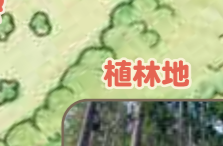
スギとヒノキの植林地