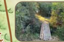
ハシノキとミズゴケの素敵な木道