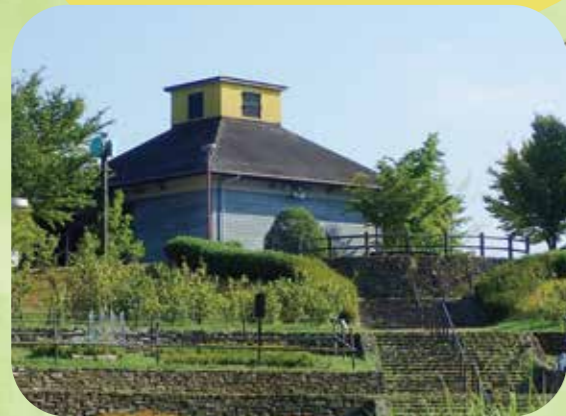
伊賀の街並みを見下ろす芝生の丘